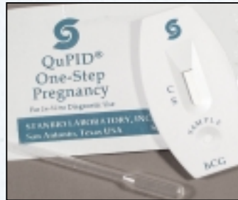
25 Pruebas – Cat. #1220-025 50 Pruebas – Cat. #1220-050