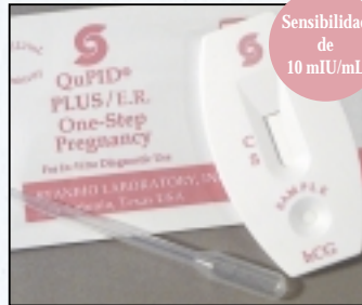
25 Pruebas – Cat. #1250-025 50 Pruebas – Cat. #1250-050