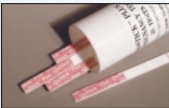
100 Pruebas – Cat. #1215-425