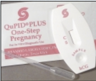
25 Pruebas – Cat. #1230-025 50 Pruebas – Cat. #1230-050