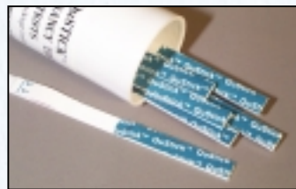
100 Pruebas – Cat. #1210-425