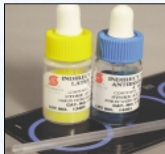
100 Pruebas – Cat. #1100-100